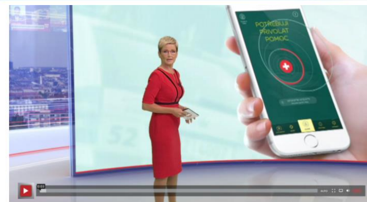
APLIKACE ZÁCHRANKA POMÁHÁ VODÁKŮM