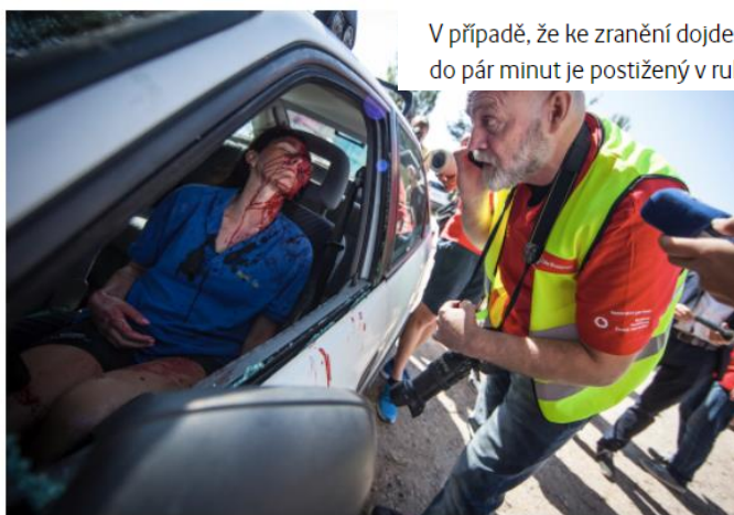
SIMULOVANÁ NEHODA S APLIKACÍ ZÁCHRANKA V REPORTÁŽI ČT

V případě, že ke zranění dojde ve m do pár minut je postižený v rukou lé